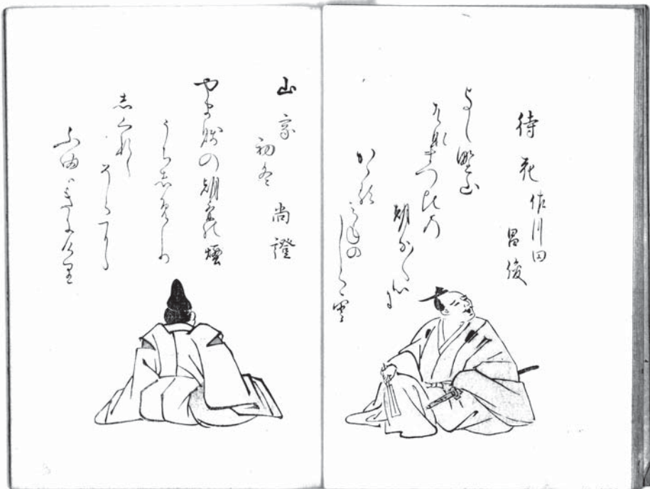
図版1 『集外歌仙』挿絵